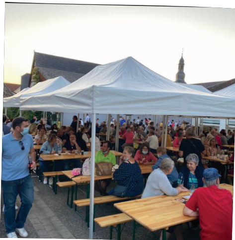
Marché nocturne vins et terroir 3 septembre 2021