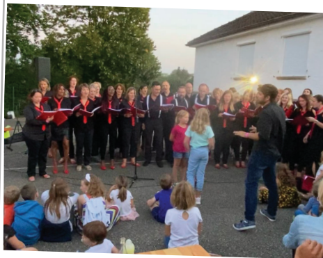
Marché nocturne vins et terroir, chorale Voc'aïne 3 septembre 2021