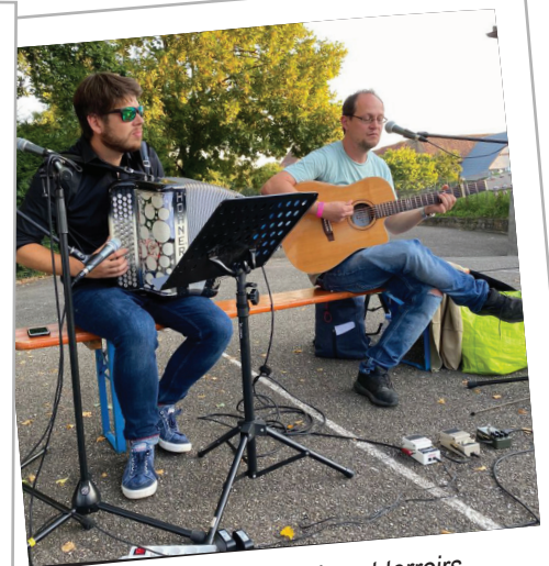
Marché nocturne vins et terroirs, Drops of Brandy - 3 septembre 2021