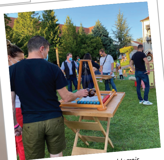
Marché nocturne vins et terroir 3 septembre 2021