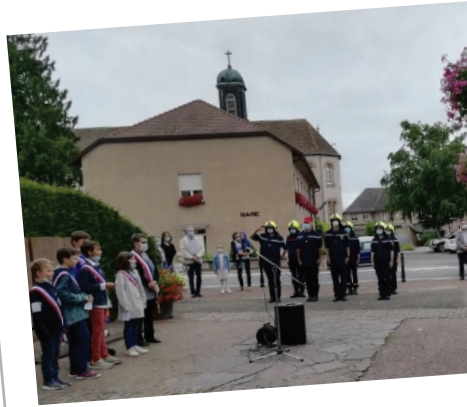
Commemoration du 14 juillet en présence du Conseil municipal des jeunes, des pompiers et de la chorale Ste Cécile.