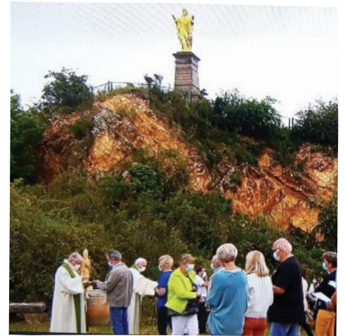
Messe filmée à ciel ouvert le 1 er août au Horn