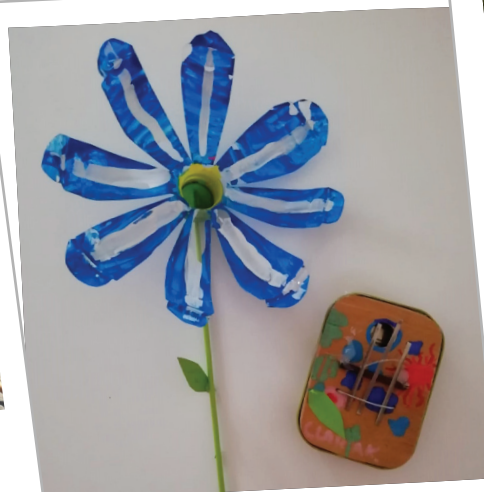
Accueil de Loisirs d'Ergersheim en juillet - exemples de bricolages réalisés