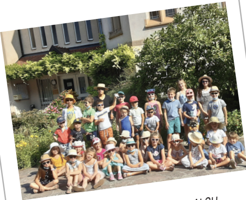
Accueil de Loisirs d'Ergersheim ALSH Promotion juillet 2021