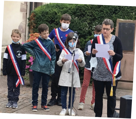
Commemoration du 14 juillet en présence du Conseil municipal des jeunes, des pompiers et de la chorale Ste Cécile.